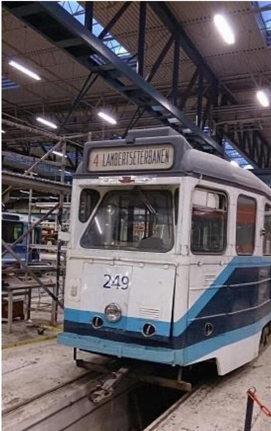
Vogn 249 på hos Mantena på Grorud høsten 2014

påsettes. Dermed blir den kjøreklar. Dette er nok en av de mest attraktive vognene i samlingen og en garantert publikumsyndling på for eksempel "Kollektivtrafikkens dag".