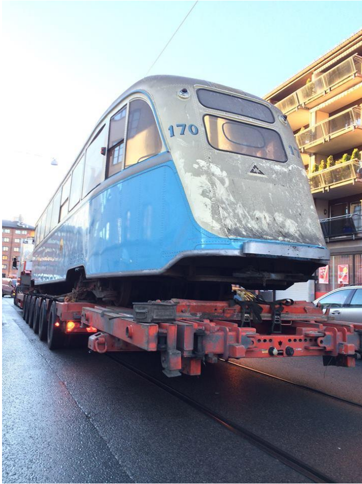
Vogn 170 på vei inn i Vognhall 5 høsten 2014